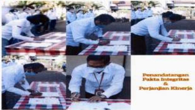
Perandatangani Pakta Integritas & Perjanjian Kinerja